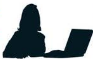
Jornalista editor, editor online, arquivista