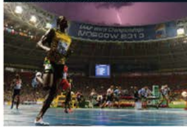
Vitória de Usain Bolt na final dos 100 metros no Mundial de Atletismo em Moscou em 2013