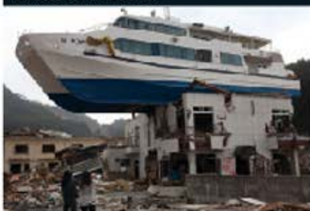
Um navio de turismo lançado em um telhado pelo tsunami em 2011 em Otsuchi, no Japão